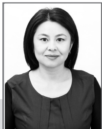
Айгуль АМРЕЕВА, председатель Шемонаихинского районного суда Восточно-Казахстанской области

Конституция Республики Казахстан, принятая 30 августа 1995 года на республиканском референдуме, является фундаментальным государственно-правовым актом нашей страны, гарантирует широкий ряд универсальных прав и свобод человека и гражданина, проведение свободных выборов, реализацию принципов единства государственной власти и разделения на три ветви, функционирование системы местного управления и самоуправления. Она действительно является Основным Законом жизни казахстанского общества, и в этом заключается ее значимость. Основной – значит обязательный для всех, исполняемый неукоснительно.