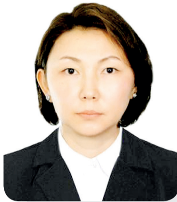
Рауана САГЫНДЫКОВА, судья Специализированного межрайонного административного суда Карагандинской области

Одной из категорий дел, по которой зачастую граждане обращаются в суд с исками о защите нарушенных прав, являются споры, вытекающие из жилищных правоотношений по вопросу приватизации жилья.