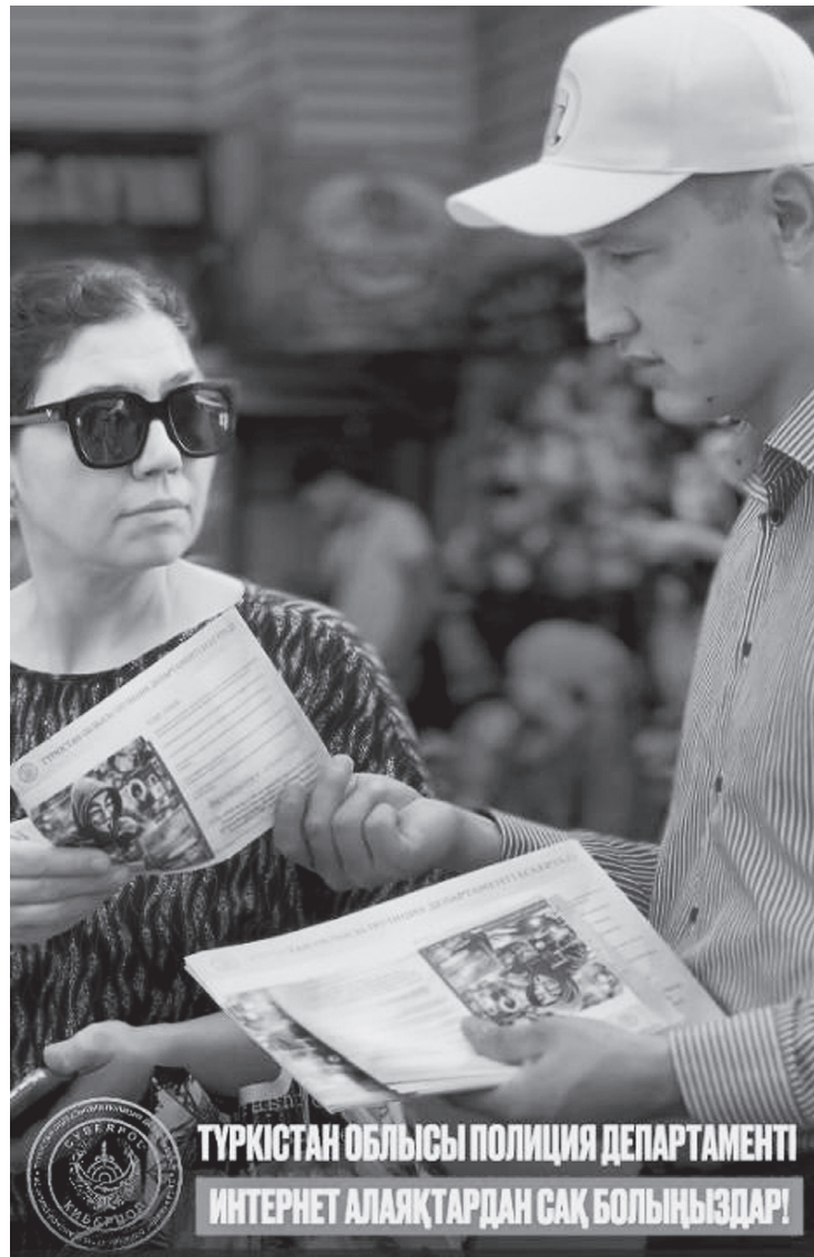
ТУРКЕСТАН ОБЛЫСЫ ПОЛИЦИЯ ДЕПАРТАМЕНТИ ИНТЕРНЕТ АЛЯҚТАРДАН САҚ БОЛЫҢЫЗДАР!

Оперативники с помощью камер видеонаблюдения установили мужчину, который приходил домой к потерпевшей за наличными. В ходе розыскных мероприятий выяснилась личность мошенника. Был задержан 33-летний житель города. Задержанный указал, что согласно инструкции, которую он получил через мессенджер, забрал деньги с указанного переписчиком адреса.