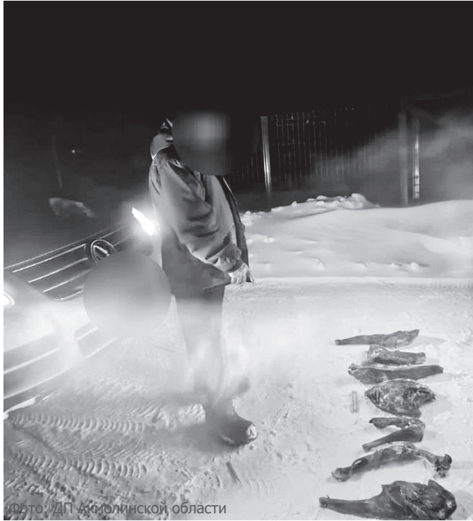
Факт ДП Акмолинской области

Напомним, что согласно ст. 337 Уголовного кодекса РК незаконная охота, в том числе с применением огнестрельного, пневматического, метательного, холодного оружия, других видов орудий добычания, собак, ловчих хищных птиц, верхового, гужевого транспорта, если это деяние совершено с причинением значительного ущерба, а равно незаконная охота с применением