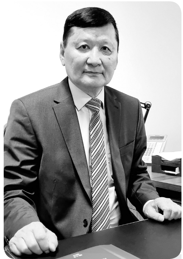
Нурлан ИБРАЕВ, судья Павлодарского областного суда

В последнее время в средствах массовой информации широко освещается тема о создании в Казахстане кассационных судов.